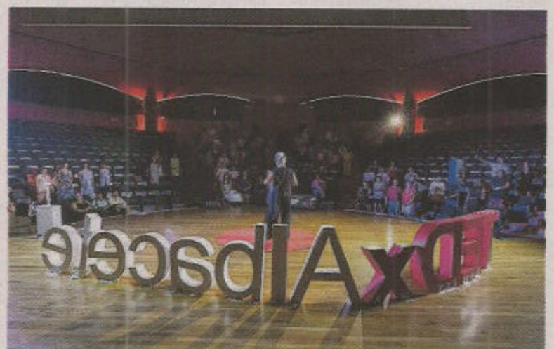
Imagen de la jornada desarrollada en el Paraninfo.